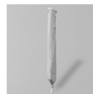
Schutzhülle mit Stab und Reissverschluss