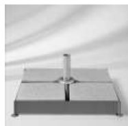
Schirmsockel 180 kg (12 Betonplatten)