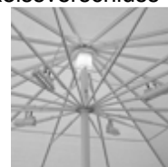
Heizstrahler, max. 4 Stk. pro Schirm