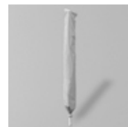
Schutzhülle mit Stab und Reissverschluss