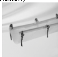
Regenrinne aus beidseitig be- schichtetem PVC