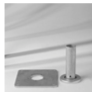
Montageplatte M4, Standrohr