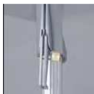
Handgriff zu M4