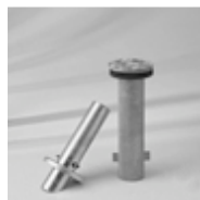
Bodenhülse M4, Standrohr