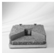
Schirmsockel 230 kg (4 Betonelemente)