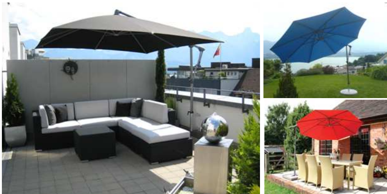
Der kleine Freiarmschirm für grossen Schatten

SUNWING® C + - jederzeit für die Sonne bereit.