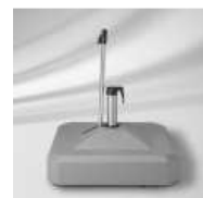
LiRo Sockel 100 kg