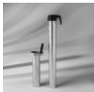
Bodenhülse & Standrohr