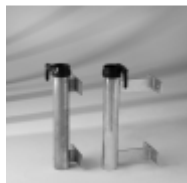
Wandbride 30 + 150 mm