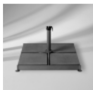
Schirmsockel 120 kg