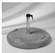
Betonsockel 90 kg