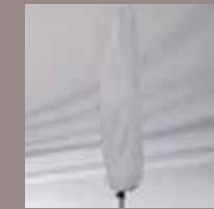
Schutzhülle mit Stab und Reissverschluss