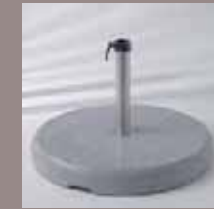
Granitsockel aus Naturstein 90 kg