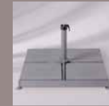
Schirmsockel M2 (8 Gartenplatten), Standrohr