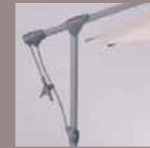
Lenkstange mit Kurbel

Werbeaufdruck: Individuelle Aufdrucke sind möglich.