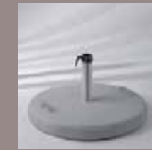
Betonsockel 90 kg