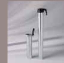
Bodenhülse mit Übergangrohr