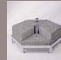
Schirmsockel 580 kg (12 Betonelemente), Standrohr verschweisst