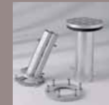
Bodenhülse M16, Aufstellscharnier M16