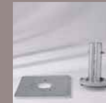
Montageplatte M16, Aufstellscharnier M16