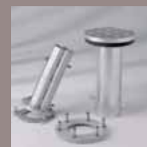
Aufstellscharnier M8, Bodenhülse M8