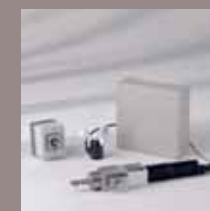
Steuerschrank, Motorantrieb, Schlüsselschalter, Windwächter