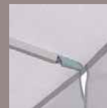
Strebenende / Strebenverlängerung