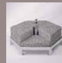
Schirmsockel 580 kg (12 Betonelemente), Standrohr verschweisst