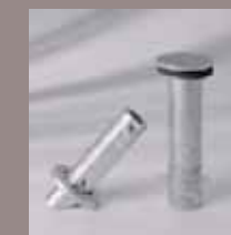
Standrohr, Bodenhülse M4