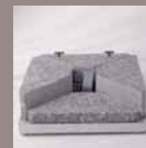
Schirmsockel 230 kg (4 Betonelemente) Schirmsockel 430 kg (8 Betonelemente), Standrohr