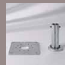
Standrohr, Montageplatte M4