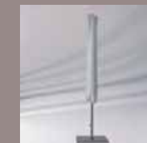
Schutzhülle mit Stab und Reißverschluss