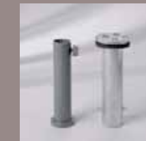
Standrohr, Bodenhülse M4