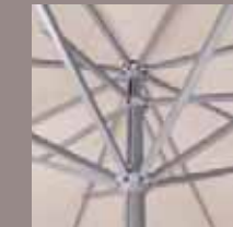
Gestell aus Aluminium