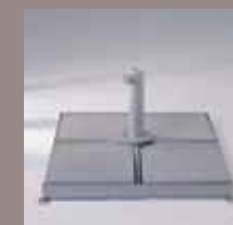
Schirmsockel M2 (8 Gartenplatten), Standrohr