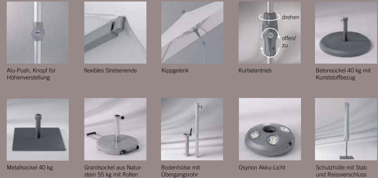
Alu-Push, Knopf für Höhenverstellung

Werbeaufdruck: Individuelle Aufdrucke sind beim Alu-Twist und Alu-Push möglich.