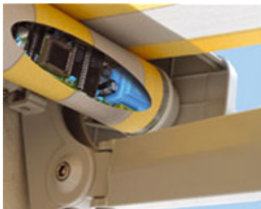
ecoLine Typ 100 300 400